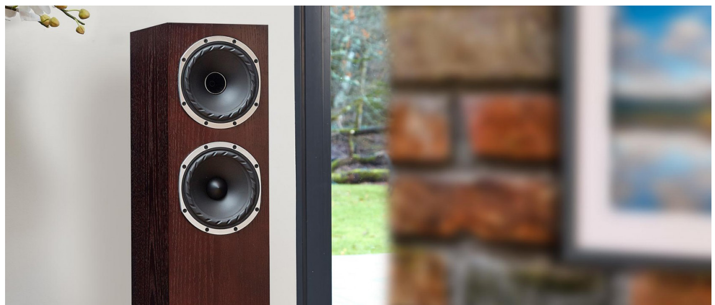
Fyne Audio - F501

Dieses Modell ist ein klassisch schöner Stand-Lautsprecher. Das Coaxial-System wird durch einen zweiten Treiber unterstützt, der unterhalb von 250 Hz für satten Bass sorgt. Dank gutem Wirkungsgrad lässt sich die F501 mit einer Vielzahl von guten Verstärkern kombinieren. Auch ältere Geräte harmonieren durchaus, moderne Elektronik nutzt jedoch das Klang-Potenzial optimal aus. Dieser Lautsprecher ist ein spannender Allrounder, der in Räumen ab 10qm bis 30qm (und darüber) sehr gut klingt.