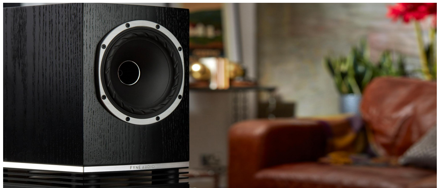
Fyne Audio - F500

Dieser Lautsprecher spielt idealerweise in einem eher kleinen Hörraum bis 20qm.